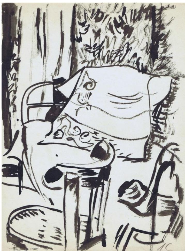
Кокандская квартира. 1968 г.