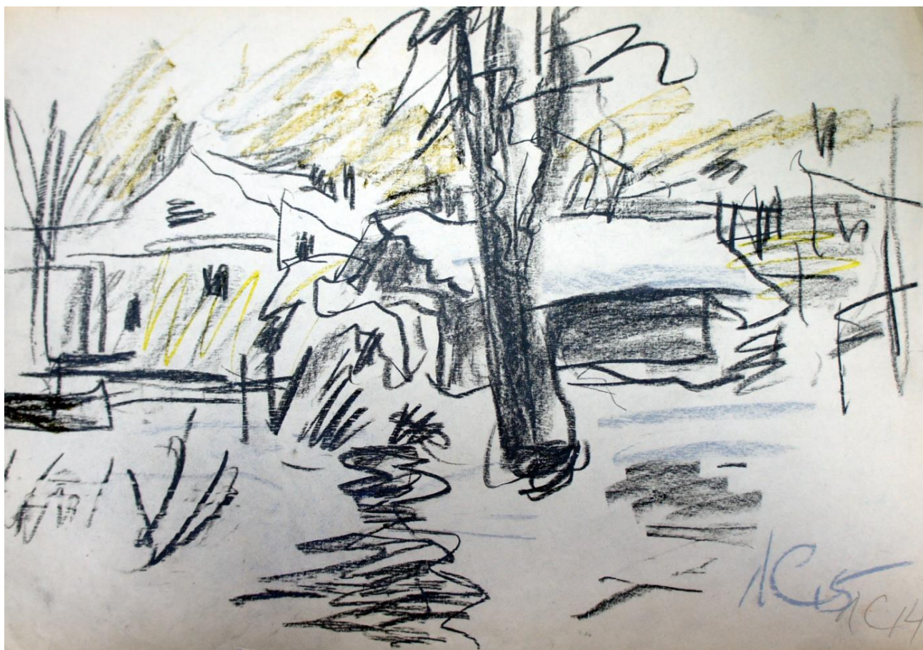
Нелидово. Мой двор. 2014 г.

Дали знать бронхи. Пришлось свернуть работу.