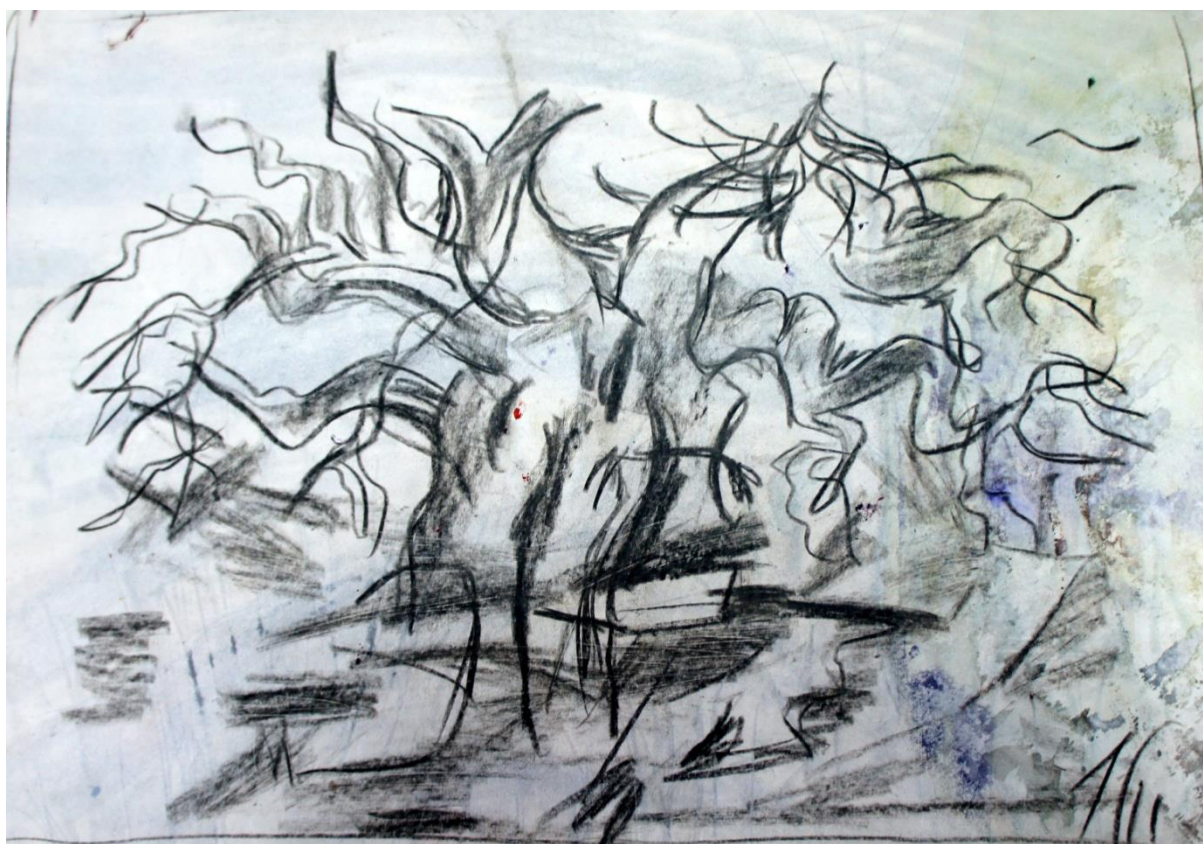
Святое дерево. 2011 г.

Творческая потребность становится основой продолжения жизни. На мой взгляд, ограничитель развития в любой сфере искусства - выдуманное человечеством понятие «формат». Это, на первый взгляд, безобидное слово «формат» не будет исключено из мира искусства никогда. Так же, как не будет исключена роль денег. Формат и деньги взаимосвязаны, неразрывны. Потребность находиться в постоянном творческом процессе помогает выживанию в трагических поворотах жизни. Художник выполняет свою миссию. Миссия не волевой выбор, не решение, миссия запрограммирована в человеке изначально природой. А художник формируется в своих исторических условиях.