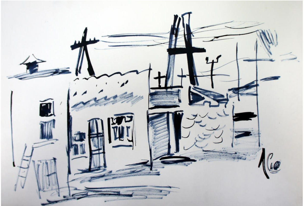
Маргилан. 2010 г.