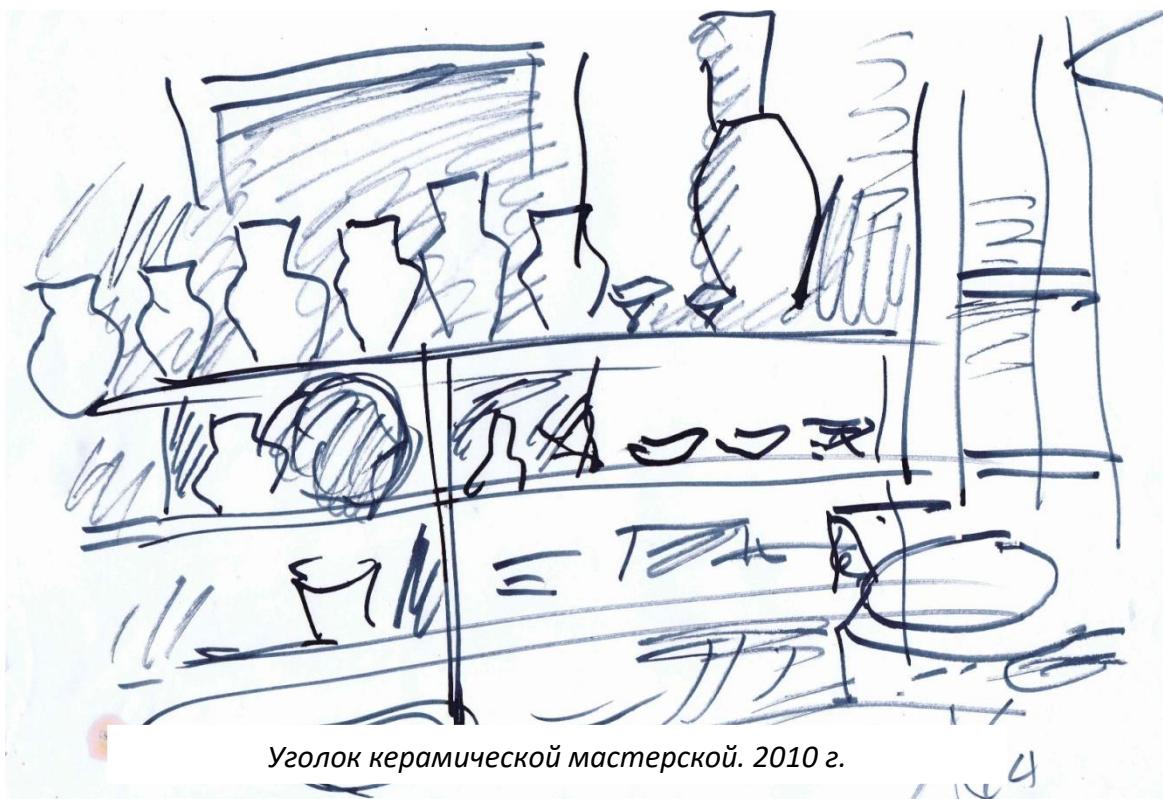
Уголок керамической мастерской. 2010 г.

В двухтысячном году состоялась моя выставка в РГГУ «Тишина