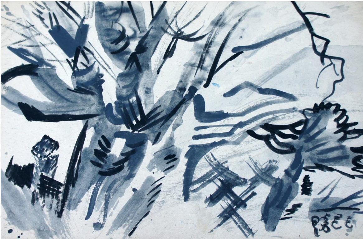
Дерево. 1987 г.

Таинственная тишина природы, впитанная с детства, жизнь земная, боль человеческой души – всё это предопределило мой творческий жизненный путь и сделало меня таким, каким я прожил жизнь, пытаюсь оставить след переживаний души в своих картинах, рисунках, акварелях.