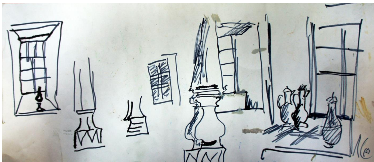
Архитектурная композиция. Заркенд (Ферганская область). Интерьер мечети. 2010 г.

Любая страна живёт, сохраняя и передавая дух своего времени, культуру своего времени следующему поколению.