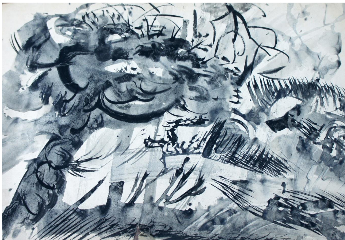
Окраина Маргилана. 1987 г.

Весной всегда тянуло за город. Быстро прогревалась земля в окрестностях Маргилана. Пробивалась нежная зелень травы. Атмосфера наполнялась теплом и покоем.