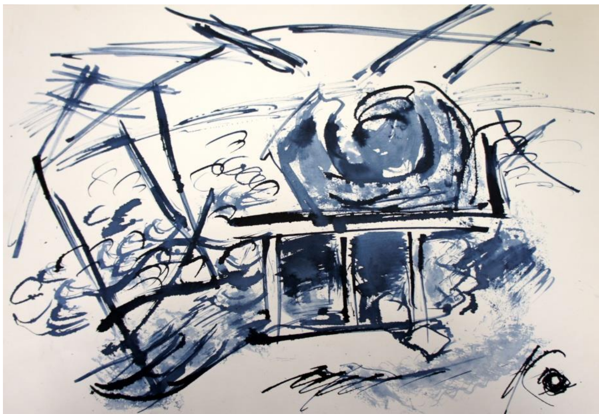
Разрушенный тандыр. 2015 г.

С молодых лет я впитал много романтических представлений о жизни. У меня нет склонности загонять мир моих жизненных впечатлений в геометрические схемы. В тоже время мои композиционные решения имеют свою закономерность, далеки от стихийного хаотического нагромождения.