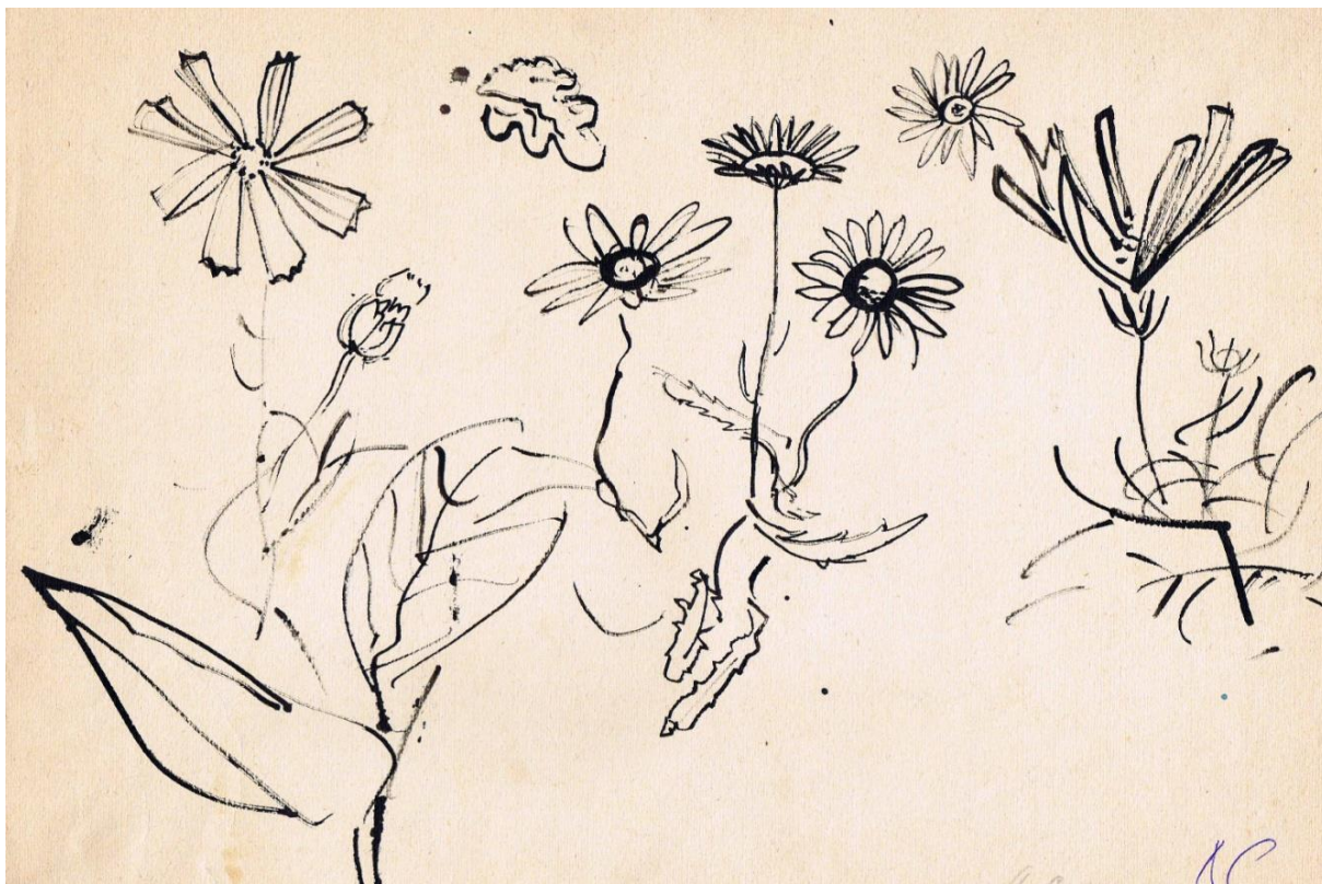
Полевые цветы. 1967 г.

Бурно меняется мир. Мир искусства, порой становится отталкивающим, вызывающим недоумение, неприятие. А в этом городе ничего не хочется менять в добрых традициях, основанных на человечности.