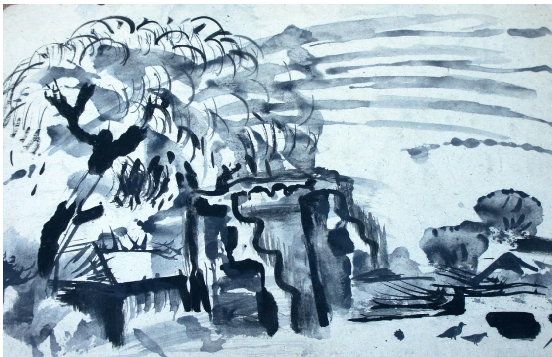
Развалины Ферганы. 1987 г.

Когда пройден длительный жизненный путь в неотступном творчестве, процесс создания любой работы становится безотносительным к чужому мнению, скорее потребностью наполнить душу тихой радостью.