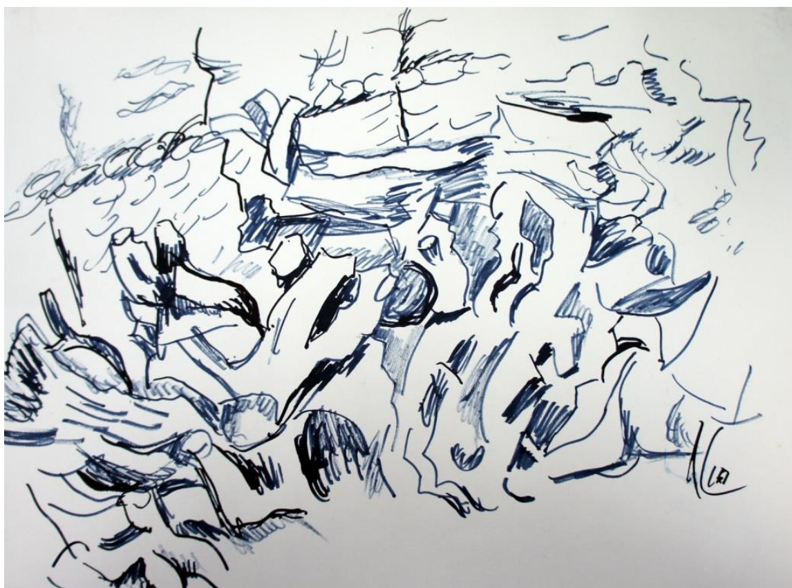
Коренья. 2010 г.

Реальность предельно проста: коллекционер, посещая меня, великодушно оставляет мне две тысячи рублей на бедность, вкладывая в этот жест искреннее сочувствие. Означает ли этот эпизод, что я