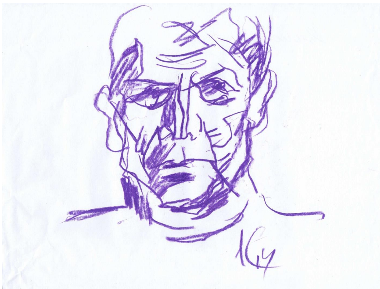
Автопортрет. 2014 г.

Жизнь стремительно меняется, хотелось бы надеяться, что к лучшему.