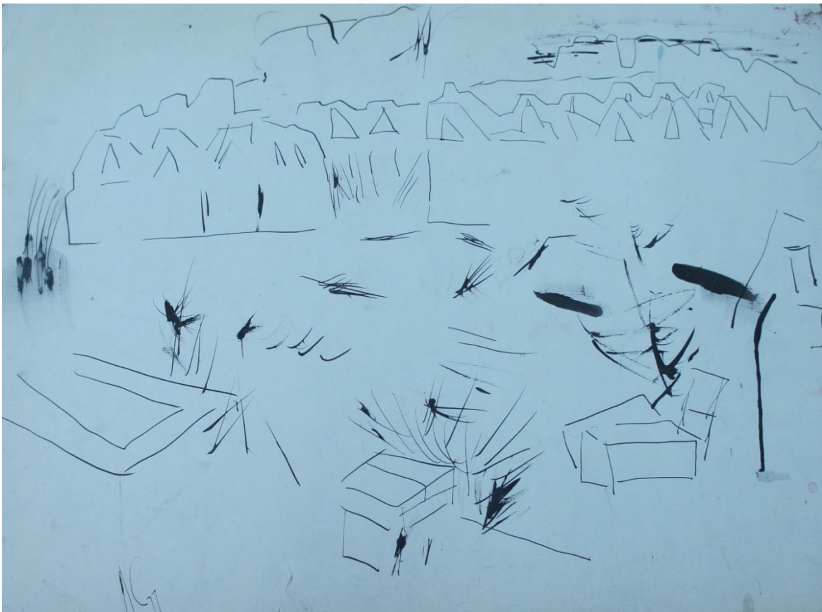
Окраина Маргилана. 1977 г.

В 20-м веке был свидетелем разрушения древних кварталов двухэтажных глинобитных домов в Маргилане. Людей выселили в коробки. На освободившейся площади строили рестораны, магазины.