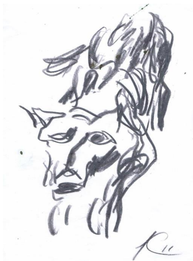
Собака. 2011 г.

Жизнь, видно, давно перекочевала из этих мест. Тропинка вывела на заброшенное пустынное кладбище. Из-за могильного камня неожиданно на меня вышла одинокая, одичавшая собака. Она печально смотрела на меня. Возможно, подумала, что и я брошенный, как она, может быть, даже посочувствовала. Мы мирно разошлись. В душе моей осталось грустное воспоминание.