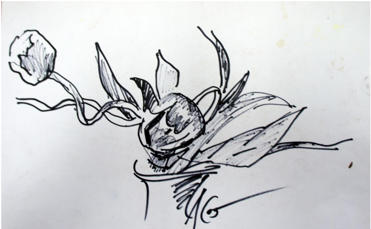
Тюльпаны. 2005 г.