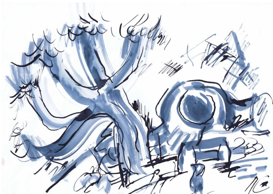
Арсив (Ферганская область). 2010 г.

Я не знаю, может ли понятие «человеческое достоинство» стать идеологией страны, или этот девиз обречён в существующем неравенстве. Такого человеческого общения теперь нет. Нет моих друзей – москвичей. Единственная радость – новый этюд, новая картина. На глазах одного поколения меняется мир до неузнаваемости. В пригородах Маргилана и Ферганы местность представляла собой дикое холмистое предгорье. Водилось множество ящериц в ярком цветовом многообразии. У входа в пещерные углубления мы находили иглы дикобразов.