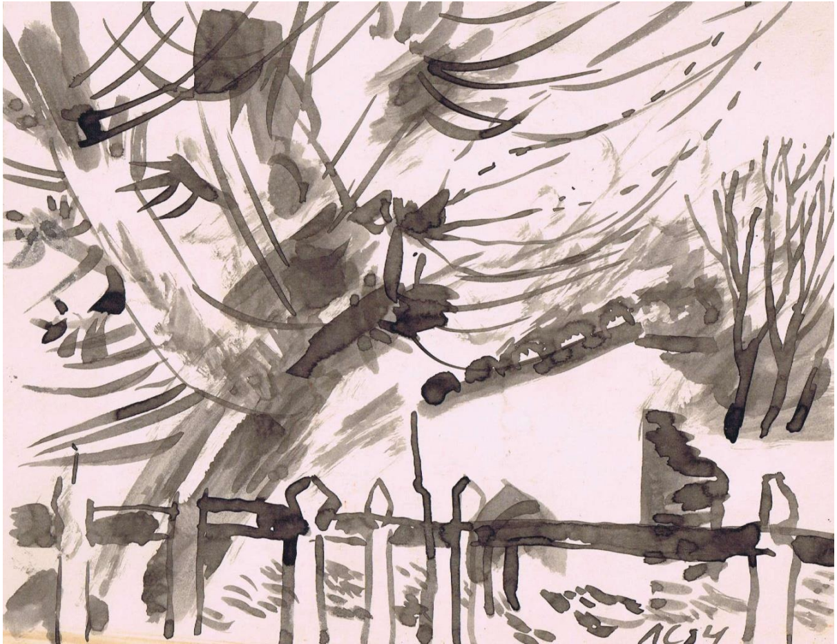
Маргилян. 1984 г.

После первого года учёбы в училище я приезжал на каникулы в Маргилян. Встретился со сверстницей, которая так же училась в каком-то московском институте. Она доказывала, что искусство – занятие никому не нужное. Я был всегда плохим спорщиком, естественно, не мог убедить её в том, что без искусства человек не человек. Теперь, когда жизненный марафон позади и я сижу дома с угасающими силами, угасающим умом, понимаю, почему я не мог её тогда переубедить, – она была права.