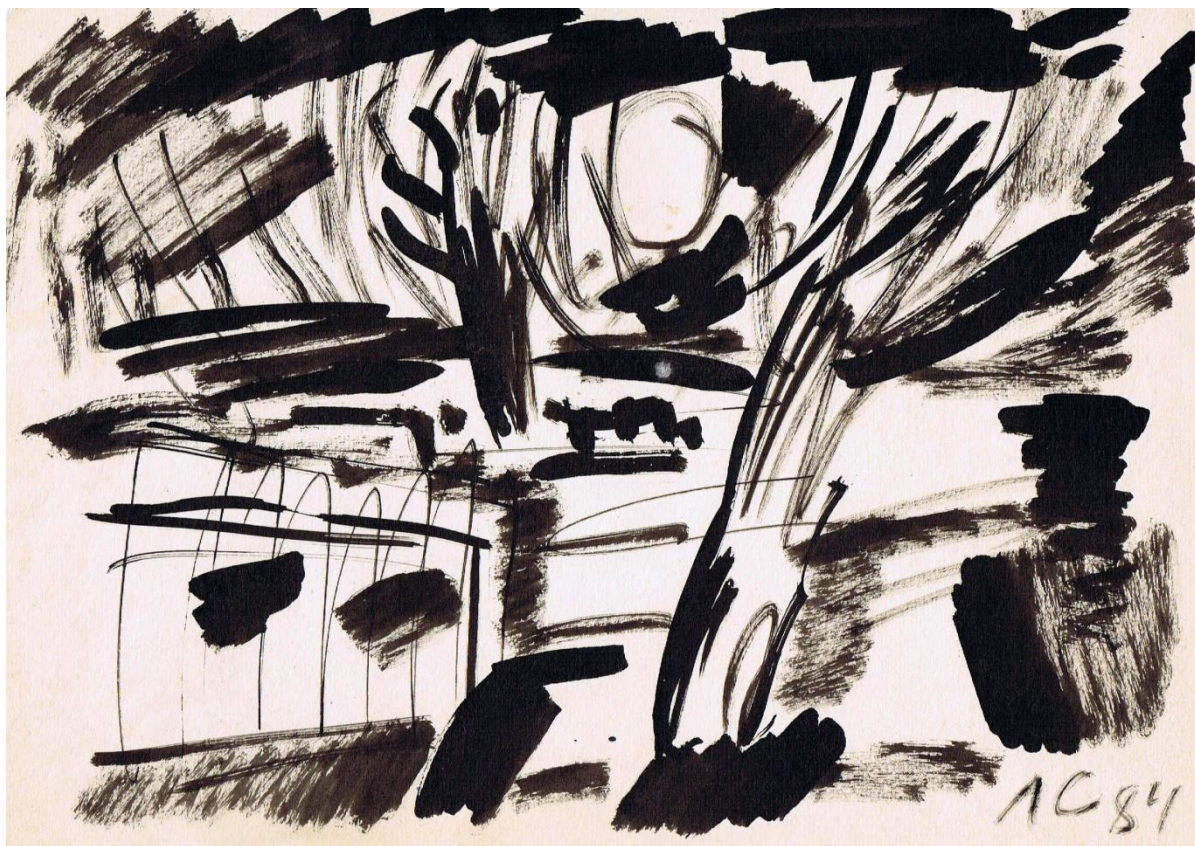
Тревожный мотив. 1984 г.

Предстояла сложная поездка в Москву, встречи с музейщиками. Я решил немного отдохнуть в любимом сквере. Стараюсь сидеть один на скамейке, постепенно впадая в дрему. Это моё обычное состояние в часы усталости. Надо мной в ветвях деревьев звонким прерывистым голосом стала петь незнакомая маленькая птица. Я пытаюсь её разглядеть, но небо, пронизанное лучами солнца, ослепляло глаза. Я опять вернулся в своё дремотное состояние. Слышу голос этой пташки всё ближе и ближе. Я открываю глаза и вижу, как маленькое красивое существо ходит около моей скамейки и что-то пронзительно пытается