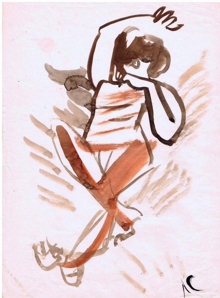
Люда. 1973 г.

Я стоял у памятника Люде. Пышно расцвёл куст хризантем. Цветы осенне-желтого цвета. Любимые цветы Люды. Я стоял и думал, вот бы Люда посмотрела на эти красивые осенние цветы. И в это время вижу большую стрекозу зелено-изумрудного цвета. Она делает круги вокруг памятника и вокруг цветов, время от времени останавливается около меня, неподвижно парит на одном месте, и вновь начинает делать круги. Кажется, она пытается что-то передать мне от Люды.