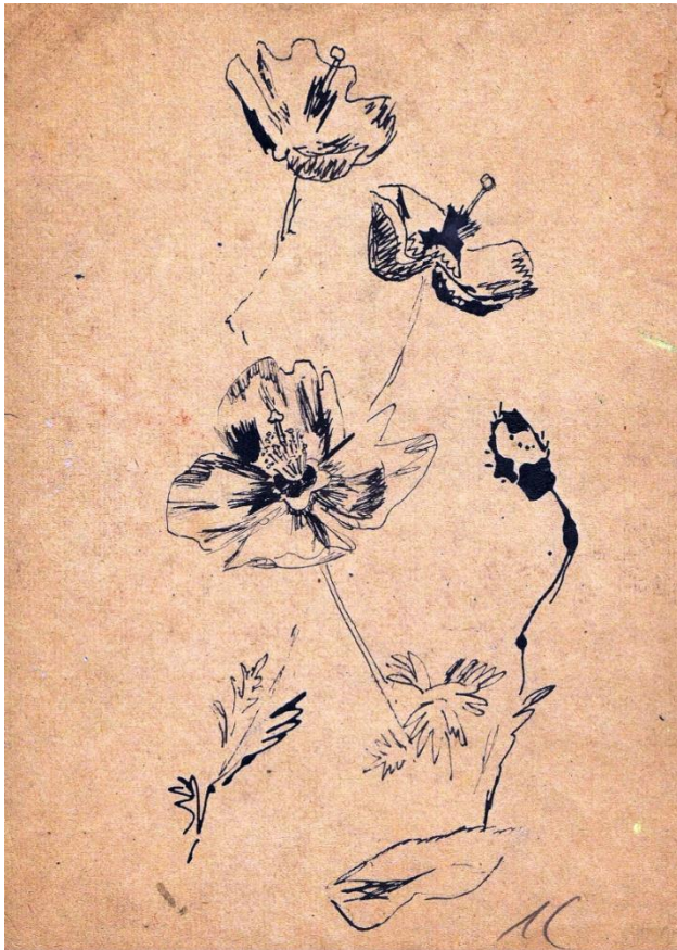
Маки. 1988 г.

Художнику достаточно испытать восторг процесса работы. Может быть, своими рассуждениями я просто пытаюсь успокоить себя, но в моей выпавшей роли я не вижу какого-либо другого спасительного сценария.