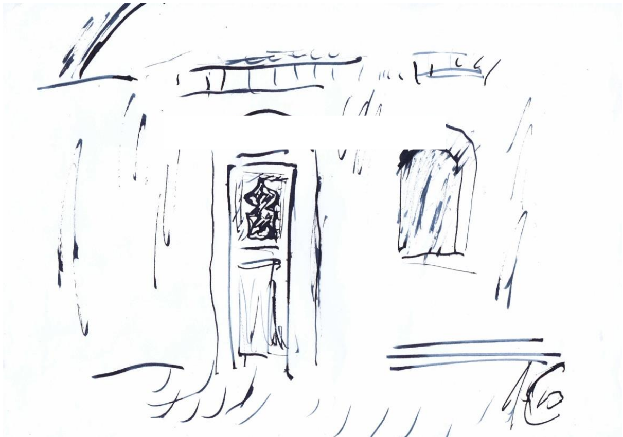
Дверь. 2010 г.

Художники расставались со своими картинами с надеждой, что они будут хотя бы скромно, но оплачены. Наивные провинциалы не могли представить уровень цинизма и жестокости новоявленных