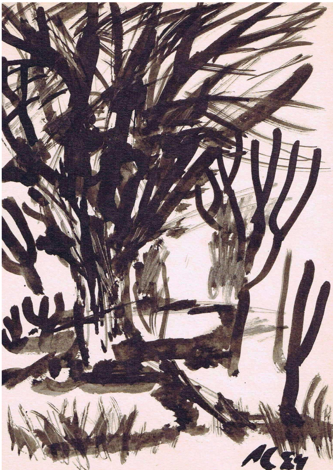
Дерево. 1984 г.

В соседнем дворе росло много деревьев. Я часто сидел под этими деревьями, работал акварелью. Надо мной, перелетая с ветки на ветку,