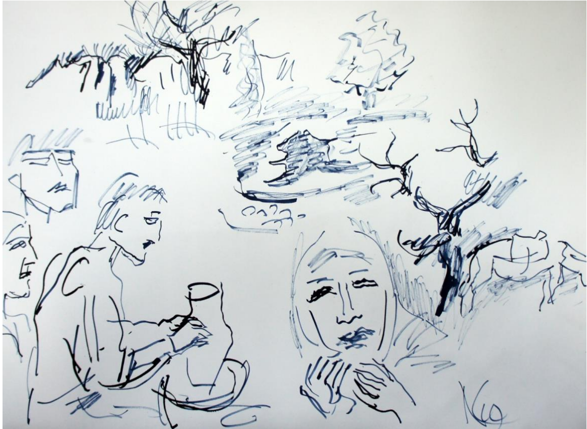
Керамист. 2010 г.

Люди этих профессий преследовались системой, вымирали, утрачивали основы существования, передаваемые от поколения к поколениям. Призыв к спасению мастеров был вызван, прежде всего, запоздалым пониманием, что государство теряет значительные валютные поступления.