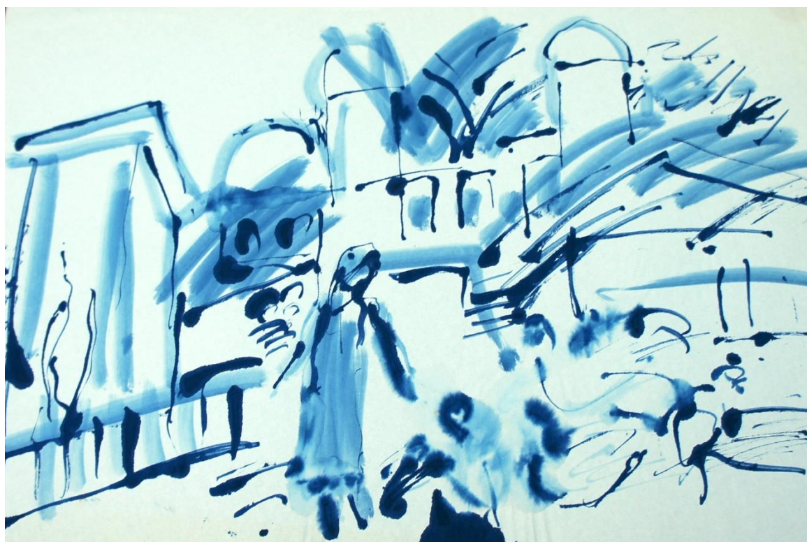
Маргилан. 2011 г.

Пролетели годы. Через двадцать лет, после того как я покинул Азию, я вновь посетил Маргилан. На асфальтированной теперь центральной площади доминировало новое здание. На месте бывшего кинотеатра – исторический музей. Я был удивлён, когда в музее увидел целую стену, увешанную моими рисунками, акварелями, картинами. В работах старый древний Маргилан. Маргилан моей молодости, Маргилан, которого уже нет. Город стал другим, чужим, перестал сниться в моих снах.