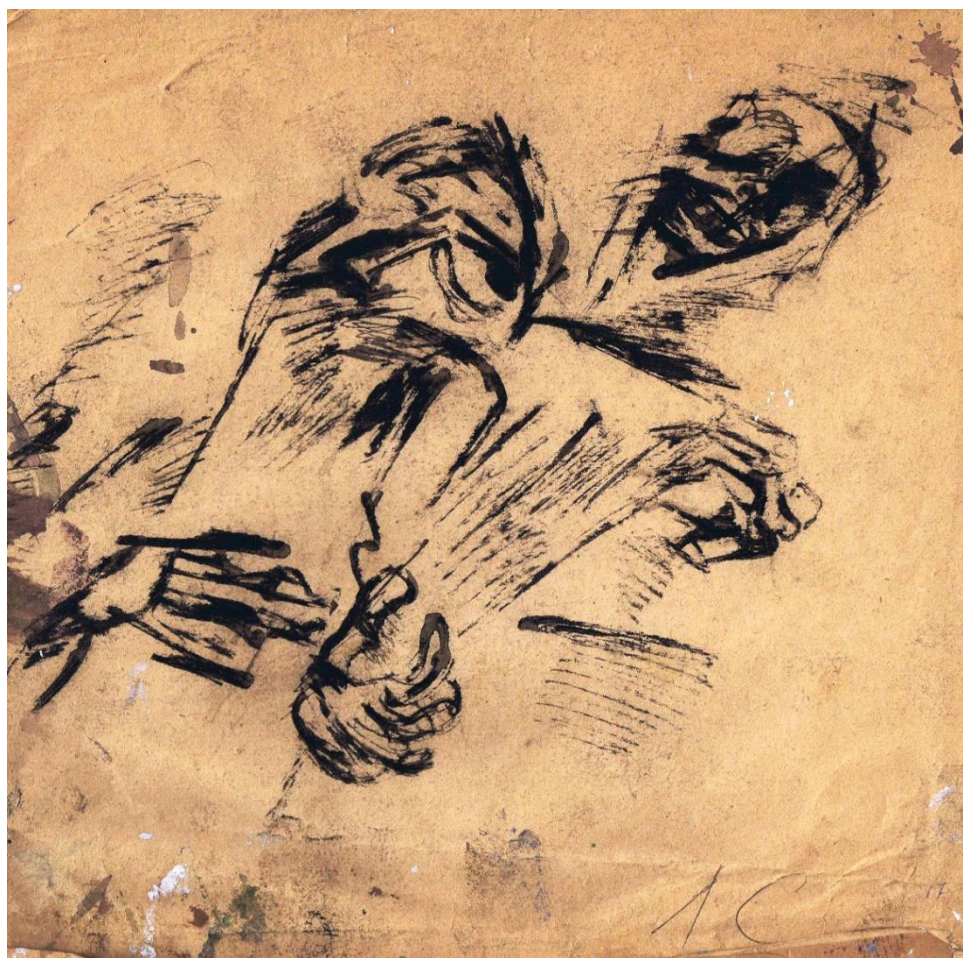
Набросок к картине

И в этом жестоком мире художник должен сохранять равновесие души, сохранять и совершенствовать культуру искусства, не имеющую ничего общего с существующими законами миропорядка.