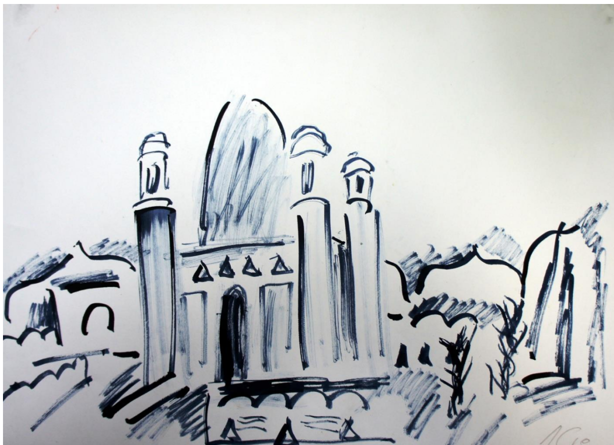
Мусульманский центр в Ферганской области. 2010 г.

На исходе сил надо дать инициативу судьбе. Судьба во всём разберётся.