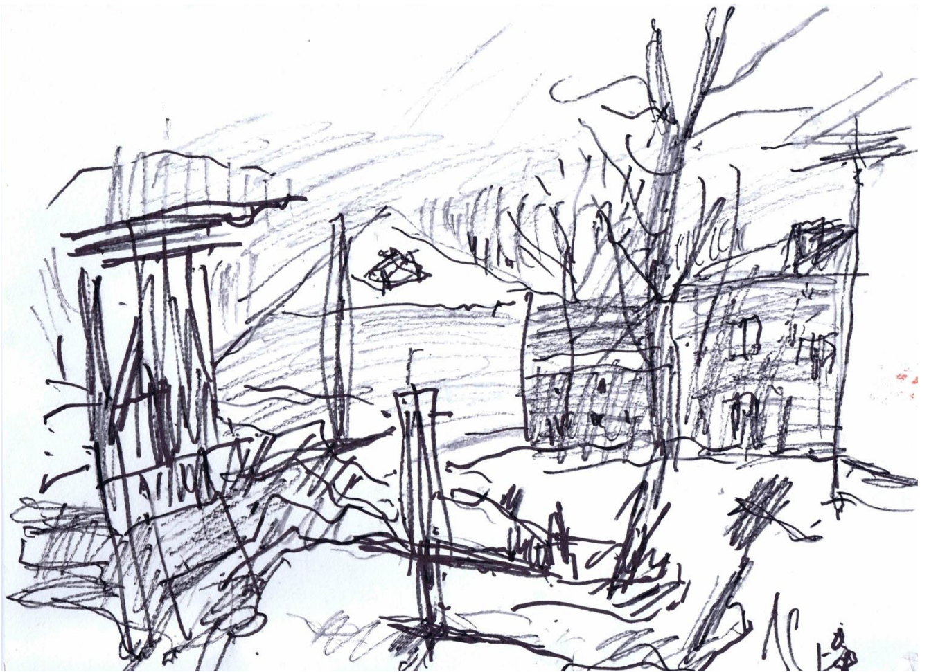
После пожара. 2018 г.

Тем не менее, интуитивно чувствую, что ускорение человечества к гибели в определённой степени связано с утратой культуры.