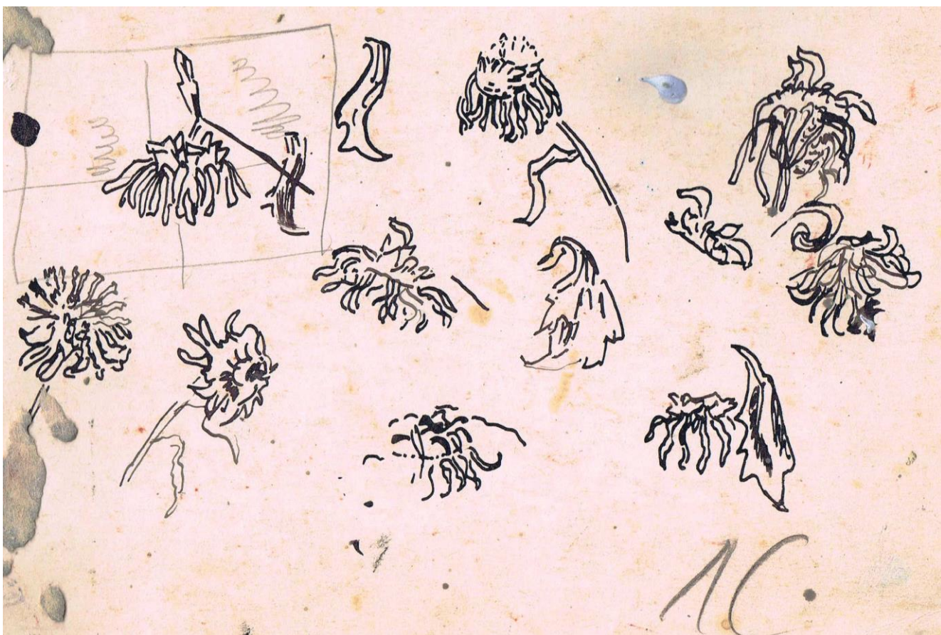
Полевые цветы. 1970 г.

Верен ли этот путь, я не могу сказать. Может быть, достаточно смолоду почувствовать в себе тяготение к тому, что близко душе, волнует душу и спокойно развивать качества, данные природой на отпущенном жизненном веку.