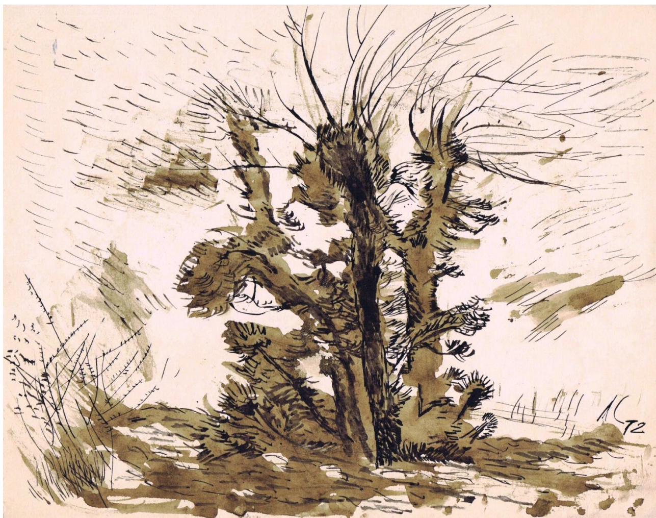
Тутовники. 1972 г.

Боря Свешников 12 однажды посетил мою выставку в ЦДХ в конце 80-х годов, сказал, что это серьёзное искусство, но от этого серьёзного ничего не осталось, всё куда-то ушло. Когда я утратил Азию, я утратил подпитку на новой земле, я утратил свой метод, свой стиль. Оставалось два варианта пути: бросить искусство или попытаться вернуться к искусству в новом режиме. Искусство, в каком бы варианте оно ни складывалось, возвращает меня к жизни.