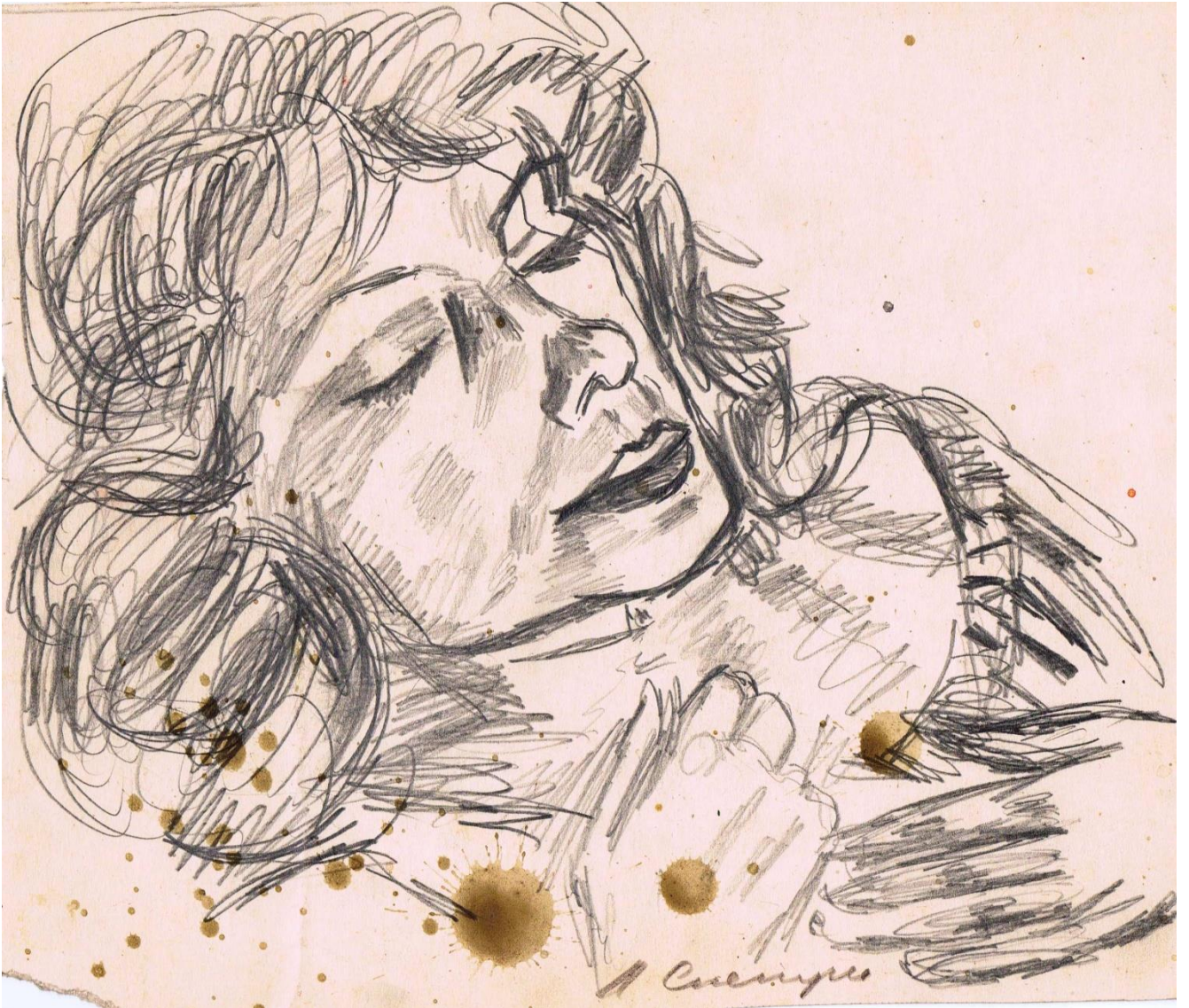
Люда. 1984 г.