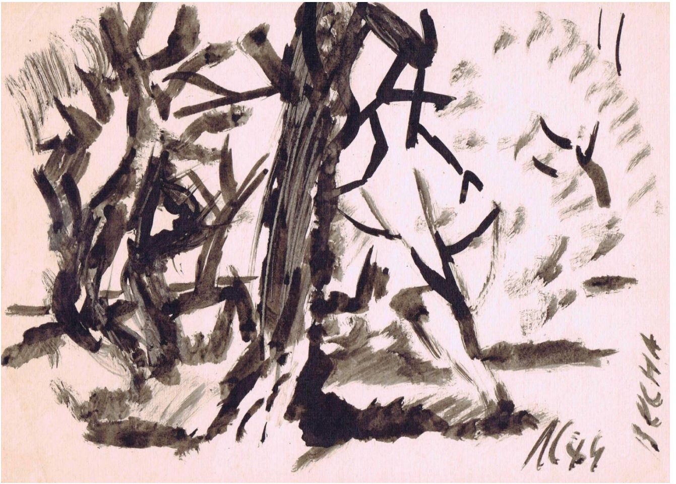
Деревья. 1984 г.

От того, насколько независима и интересна программа и от того, какие волевые усилия прилагает художник для осуществления этой программы, зависит результативность его творчества.