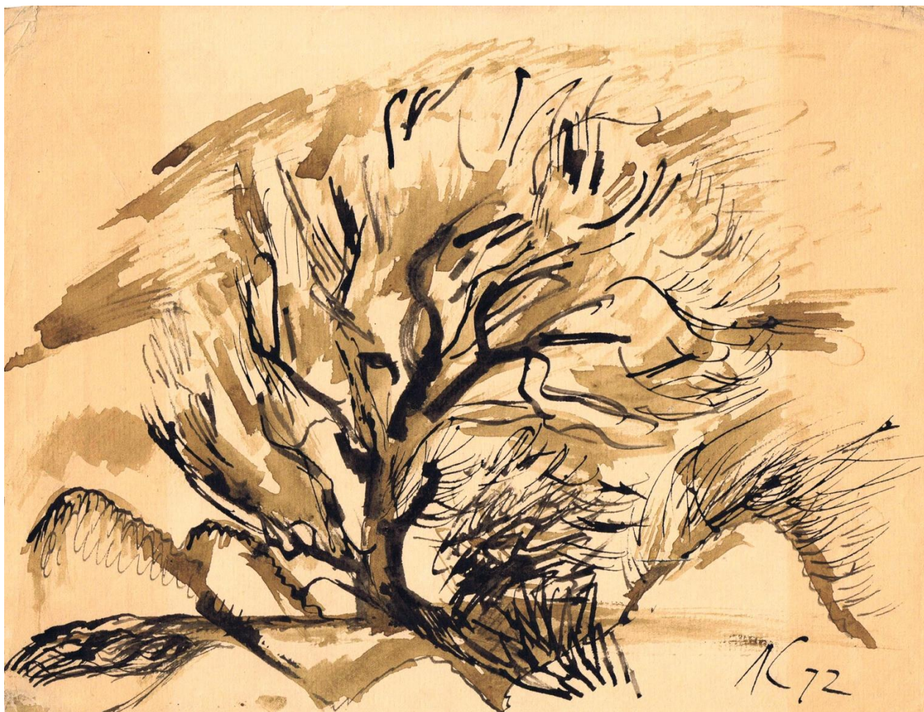
Дерево. 1972 г.

Природа дала мне достаточно физических сил, позволявших время от времени бросать всё и удаляться в окружающую земную жизнь, радоваться природе, жизни, творчеству.