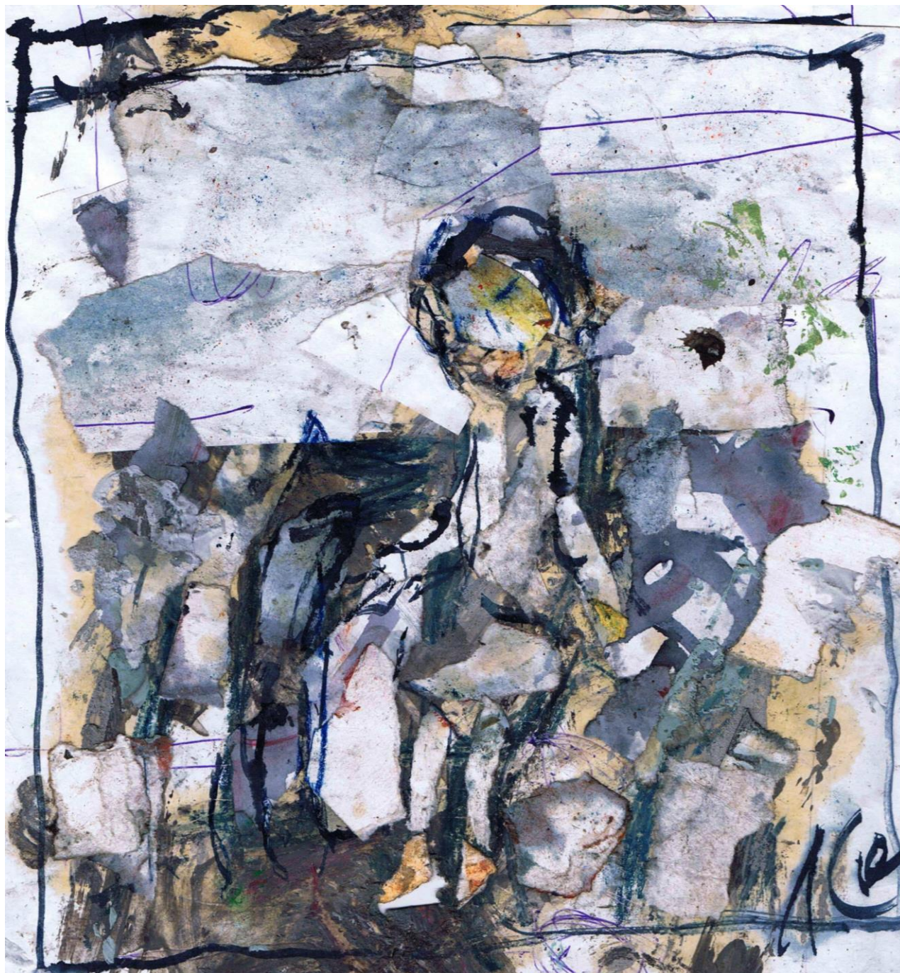
Девочка и собака. 2015 г.