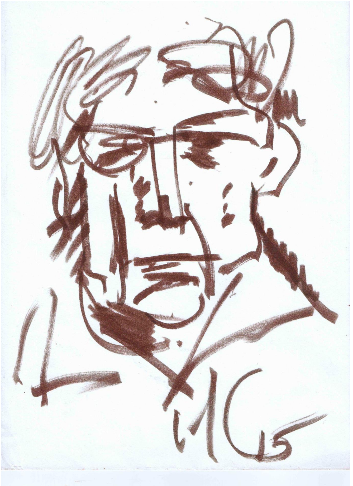
Автопортрет. 2015 г.