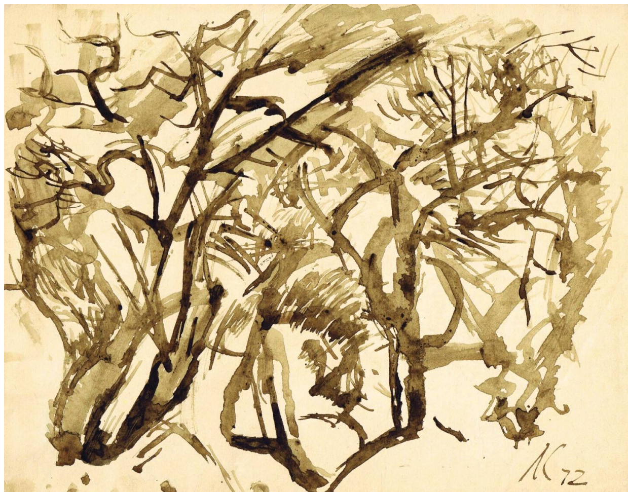
Деревья. 1972 г.

В молодости, интуитивно, опорой моего творчества была жизнь, теперь, в свои почтенные годы, я острее и осознанно понимаю, как завязан с жизнью. Продолжая творчество, опираюсь на всё, что меня окружает.