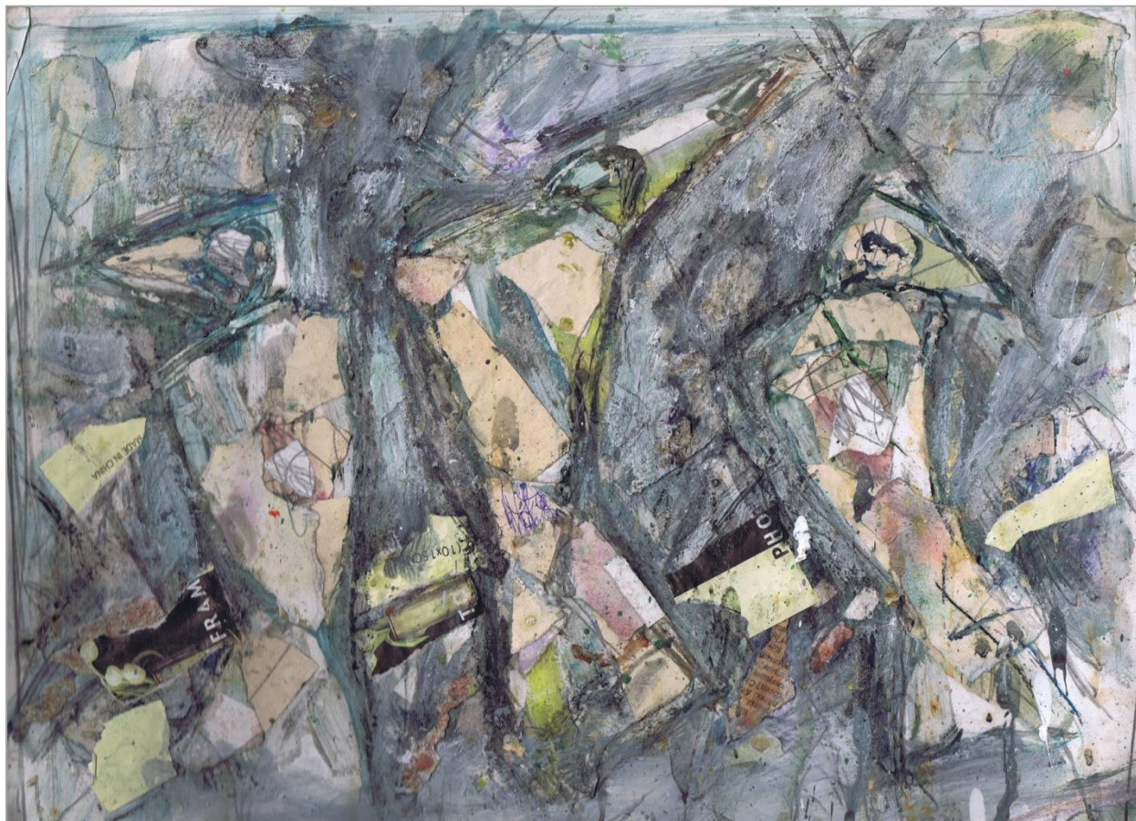
Три грации. 2006 г.

Одни ищут утешение в молитвах, другие в размышлениях.