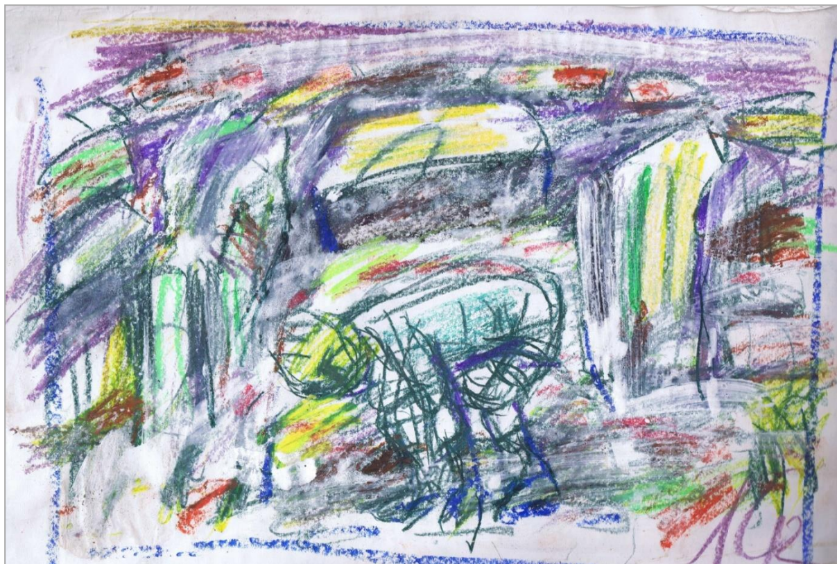
Мальчик, собирающий камни. 2012 г.

Это было намного позже, а в те далёкие годы, оказавшись в гражданских условиях жизни, отец выписал из Москвы книги по бухгалтерии и постепенно стал осваивать профессию бухгалтера.