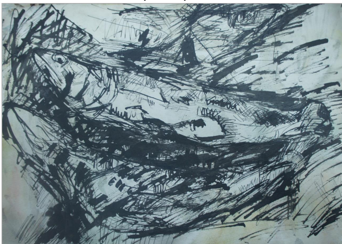
Рыба. 1970 г.

Жизнь в непрерывном движении, жизнь в сомнениях. Жизнь в иллюзиях, жизнь, не знающая покоя, – такова участь художника.