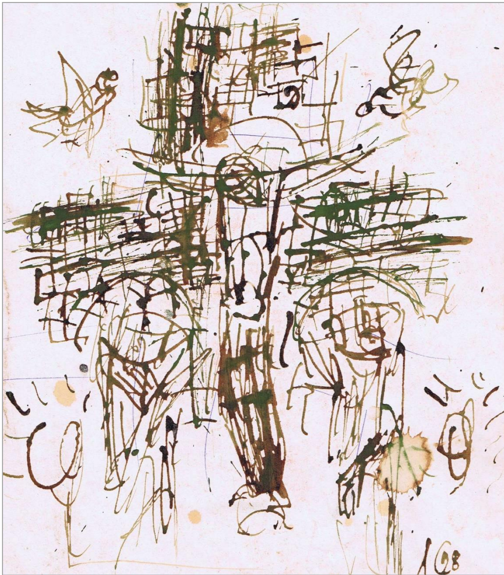
Спаситель. 1998 г.

Стремительная смена легковесных новаций в искусстве может загнать человеческую культуру в глухой тупик, откуда обратный путь станет невозможным.