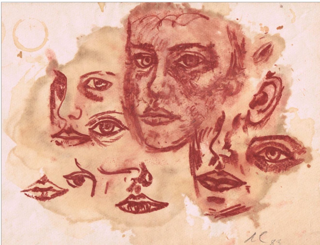
Рисунок к портрету сына. 1983 г.