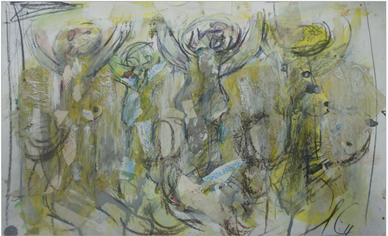
Встреча инопланетян. 2011 г.

Мне в своей провинциальной глубинке трудно понять, что происходит в мире искусства.