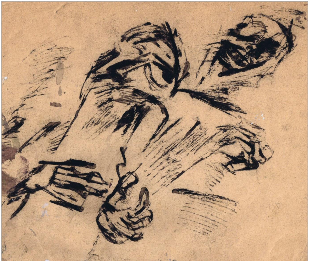
Набросок картине. 1982 г.

А искусство обречено постоянно быть в состоянии развития, движения, независимо от исхода этого движения. Но если зритель всеяден, художник ограничен своим сформировавшимся миром, своей системой мышления.