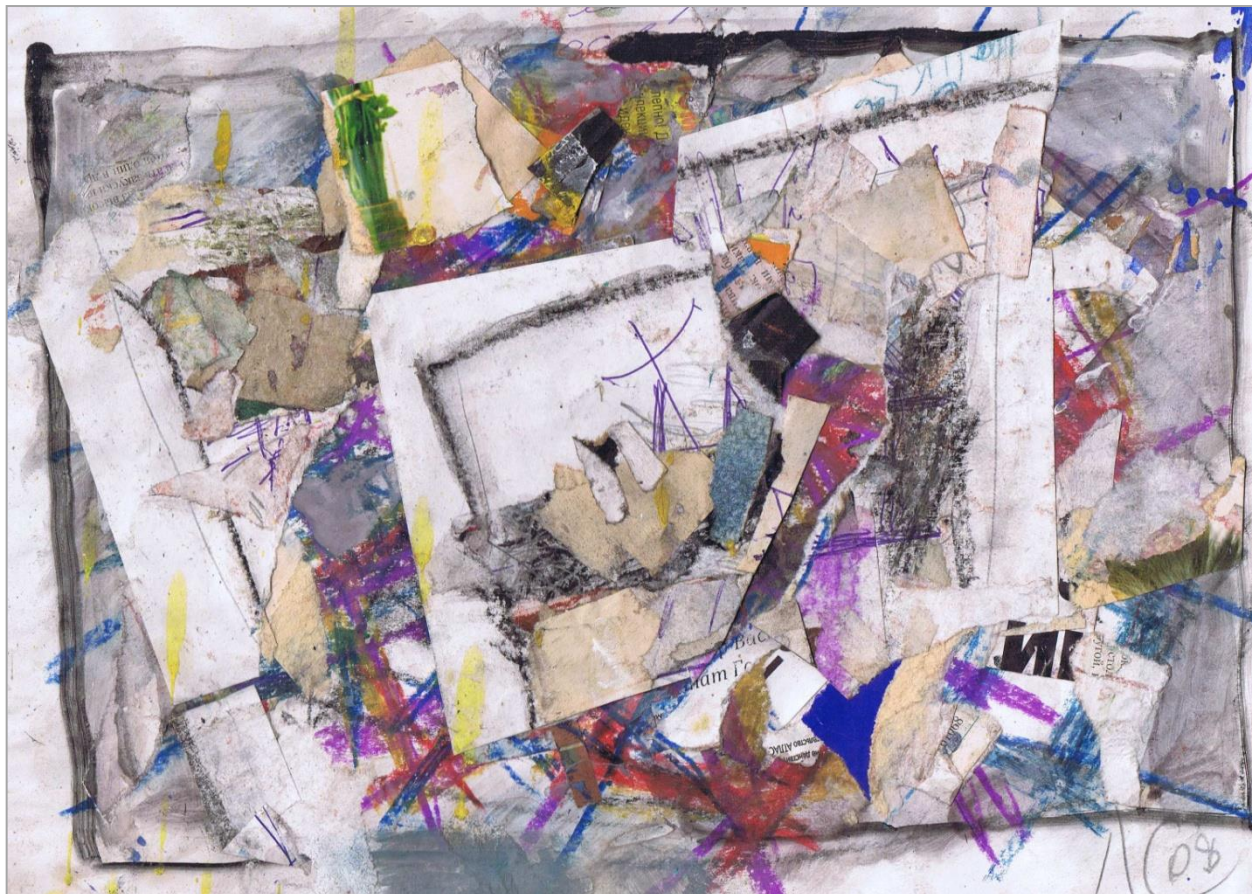
Ностальгия. 2008 г.

Иногда вспоминаю годы молодости, скитания, таинственную жизнь первозданной природы, аромат цветущих деревьев в весенние дни.